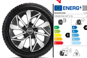
Комплект зимни гуми BRIDGESTONE с алуминиеви джанти 18" TMEWA42065DY