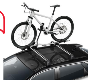
Държач за велосипед PW30800007